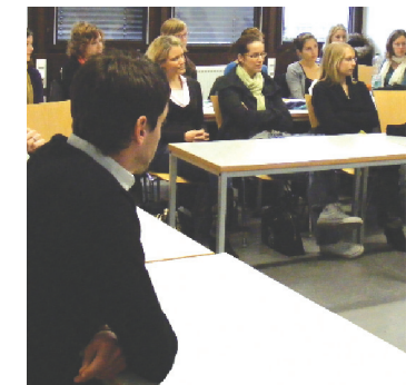
STUDIUM UND LEHRE | AKTUELLES | KONTAKT

kultät Rehabilitationswissenschaften > Studium und Lehre > St